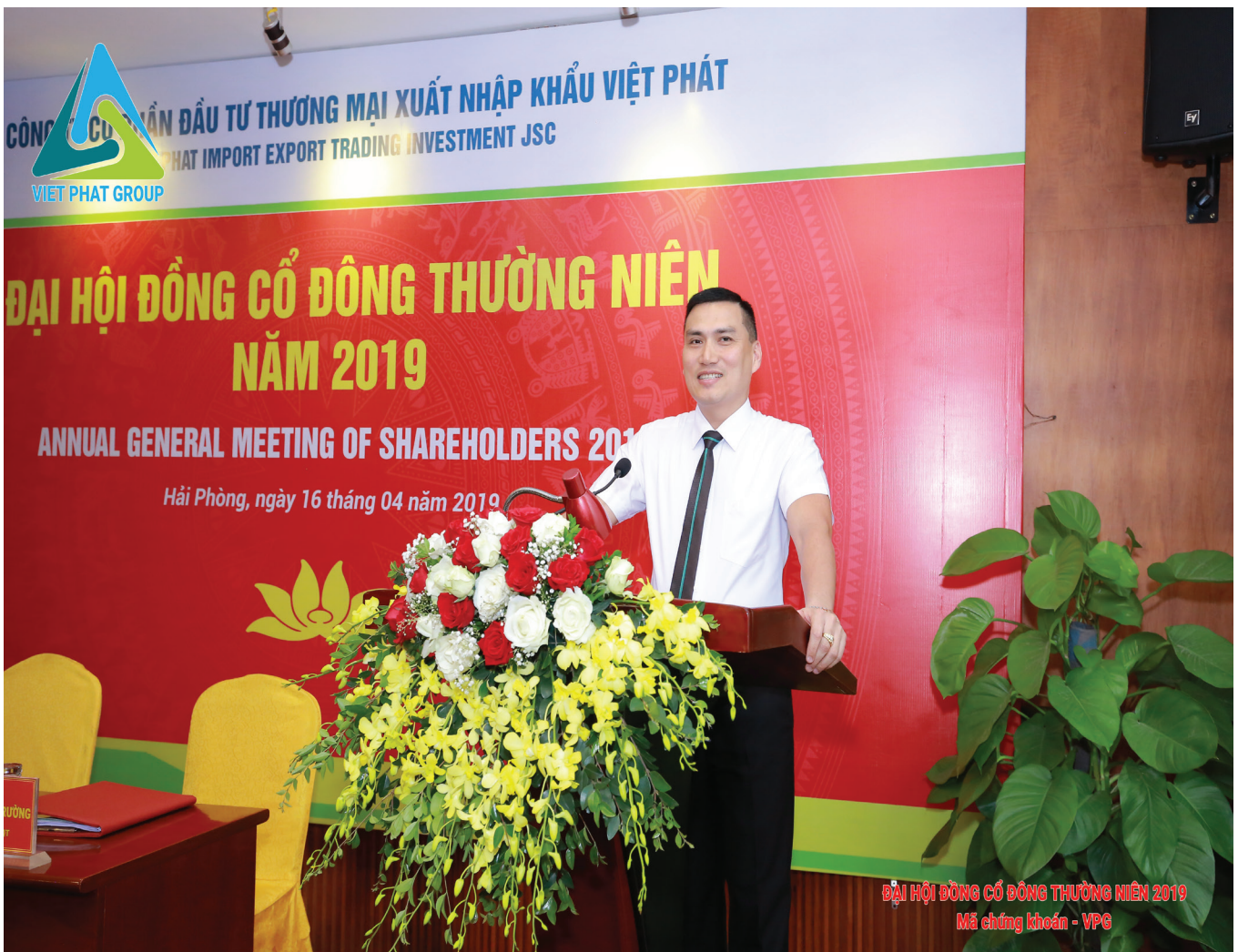
ĐẠI HỘI ĐỒNG CỔ ĐÔNG THƯỜNG NIÊN 2019 Mã chứng khoán - VPG

Hội đồng quản trị đánh giá cao sự tận tâm, nỗ lực và tinh thần đoàn kết của Ban Tổng Giám đốc Công ty. Ban Tổng Giám đốc đã cùng với Trưởng các phòng ban, Chi nhánh và các bộ phận quản lý trong Công ty có nhiều nỗ lực và luôn dành hết tâm huyết cho việc lập kế hoạch chiến lược kinh doanh, điều hành linh hoạt mọi hoạt động sản xuất kinh doanh, thu hồi công nợ kịp thời, quản lý hiệu quả đồng vốn, nhằm đưa Công ty phát triển. Kết quả kinh doanh trong năm 2019 đã phản ánh đúng mọi hoạt động của Công ty.